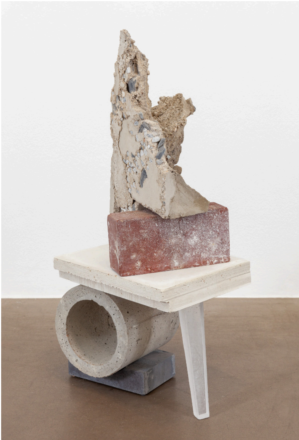
Kai Schiemenz Click, Clack, Creak, Sneak, 2024 Keramik, Glas, Beton 78 x 35 x 44 cm