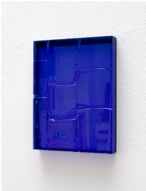
Kai Schiemenz Malerei I (blau), 2024 Glas 27,5 x 11 x 3,5 cm