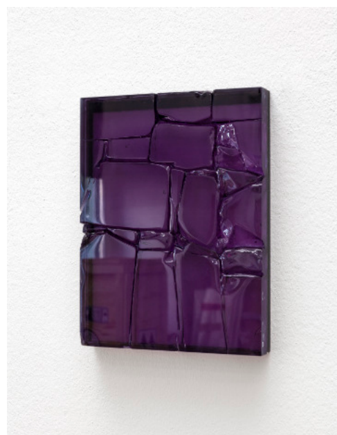
Kai Schiemenz Malerei III (purple), 2024 Glas 27,5 x 11 x 3,5 cm