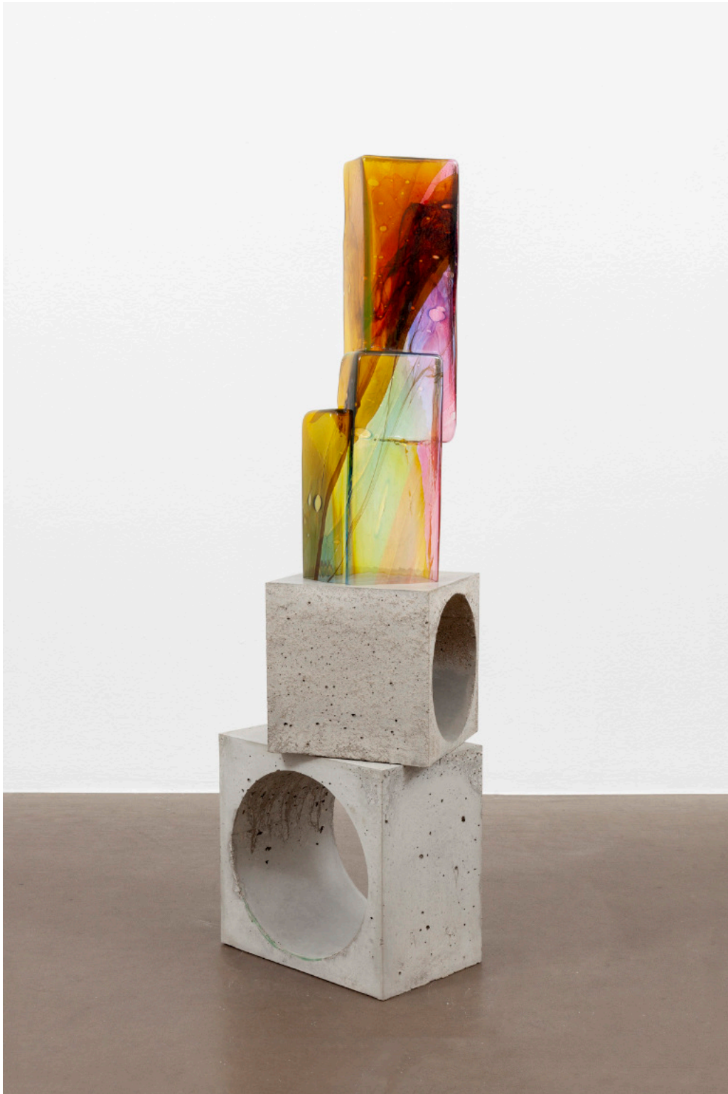
Kai Schiemenz Dizzying Delights, 2024 Glas 56 x 18 x 12 cm