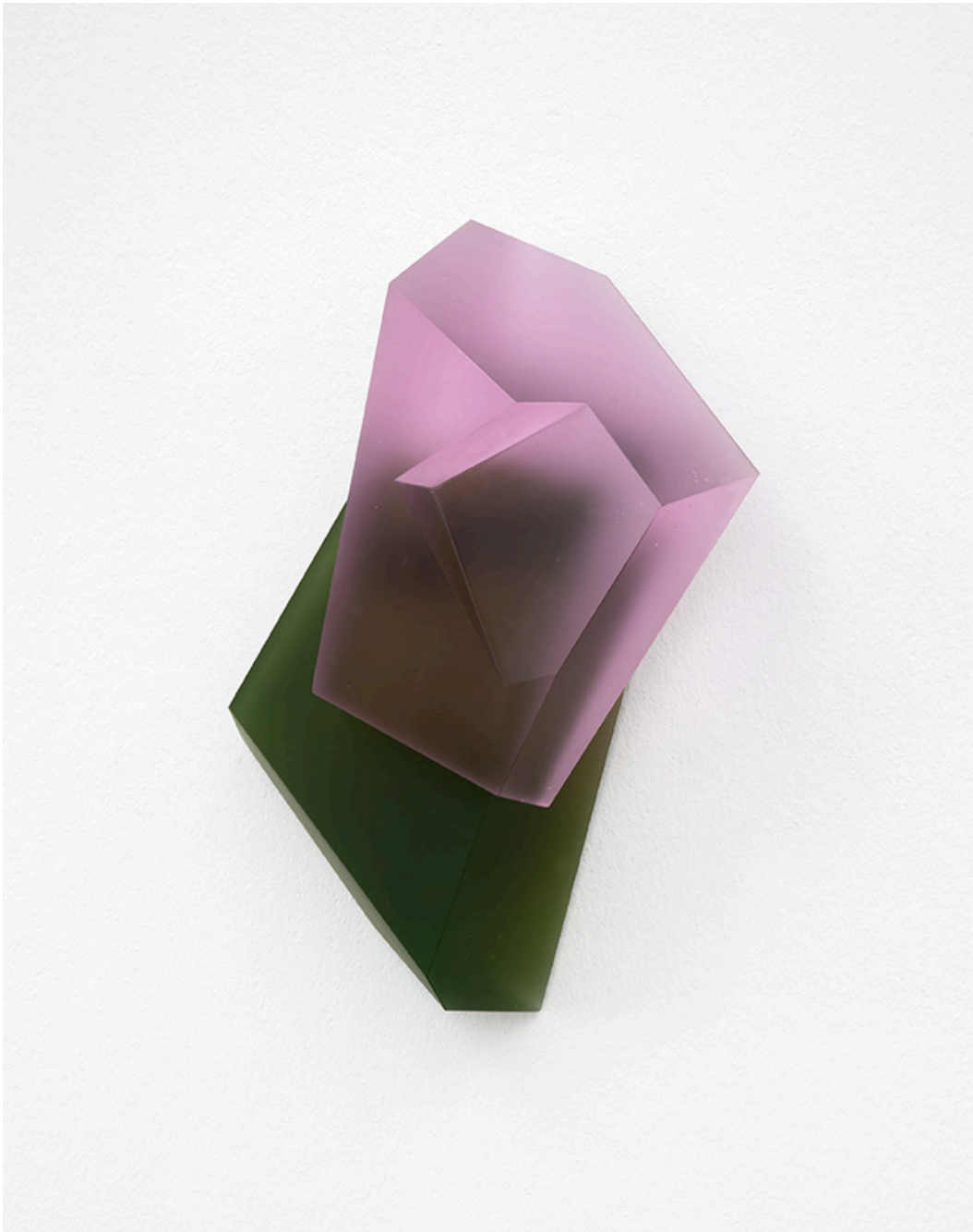
Kai Schiemenz Tilted Blocks II, 2024 Glas 28 x 11 x 18 cm