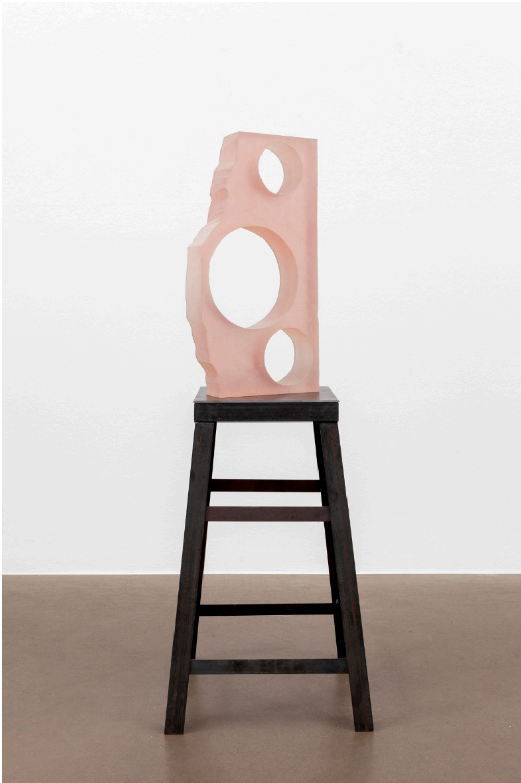
Kai Schiemenz Drei Sterne, 2024 Epoxy 52 x 30 x 8 cm