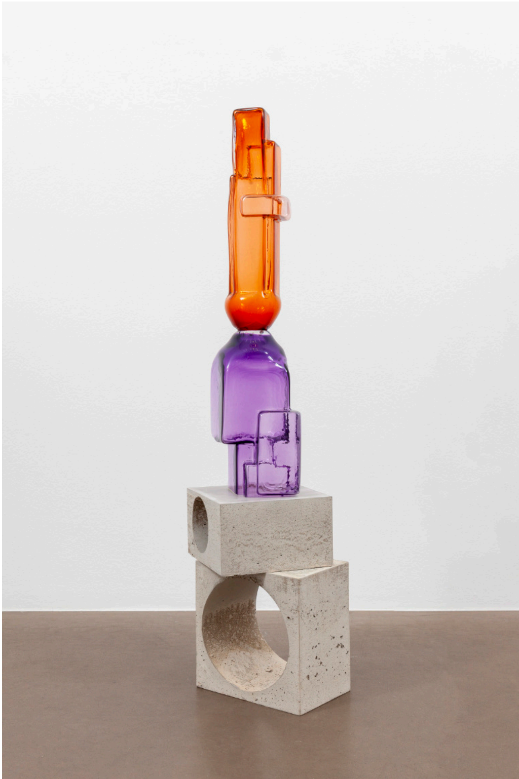
Kai Schiemenz Tentalo Salvataggio, 2024 Glas 92 x 18 x 20 cm