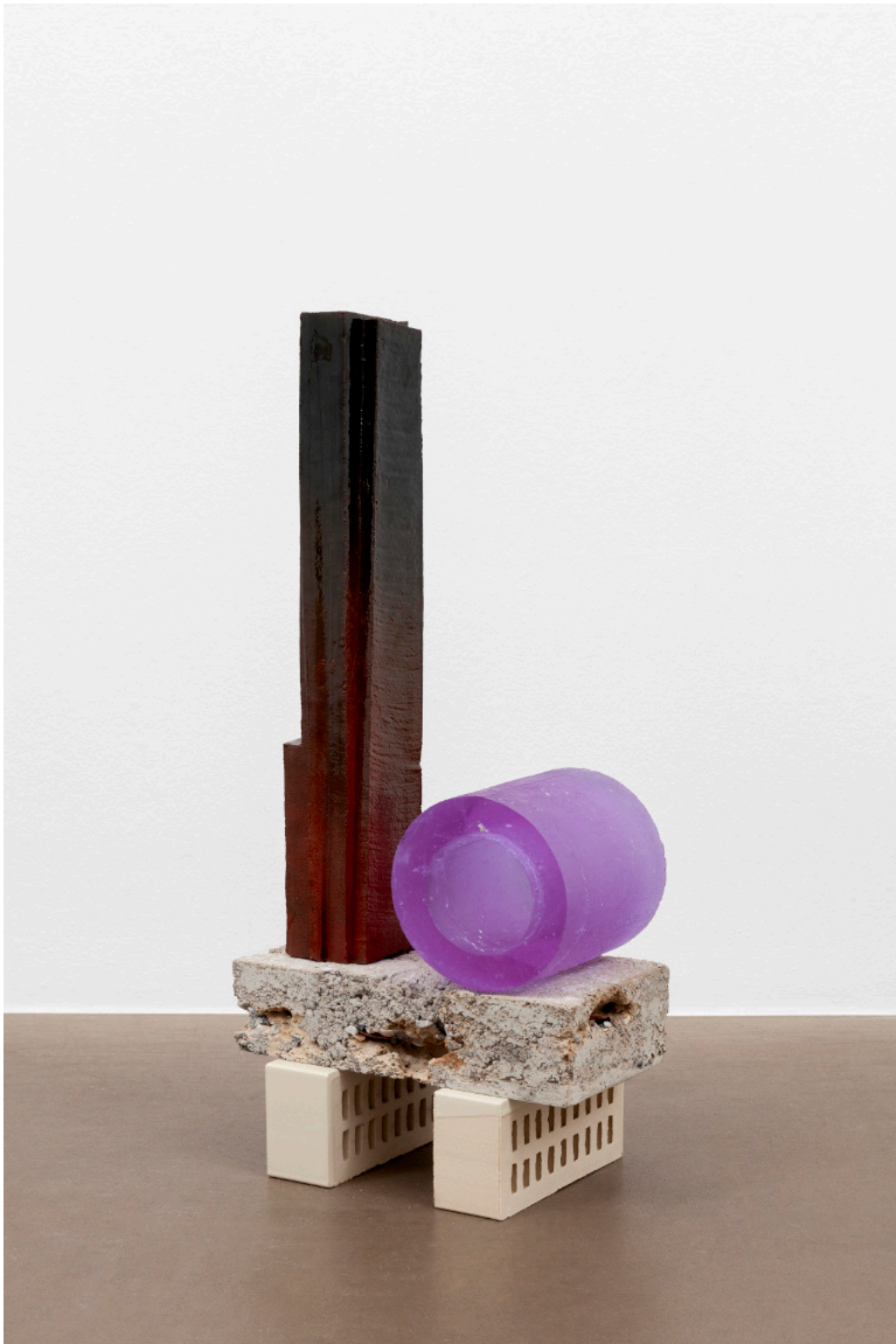
Kai Schiemenz ohne Titel (Modellfabrik), 2024 Glas, Keramik, Beton 82 x 38 x 23 cm