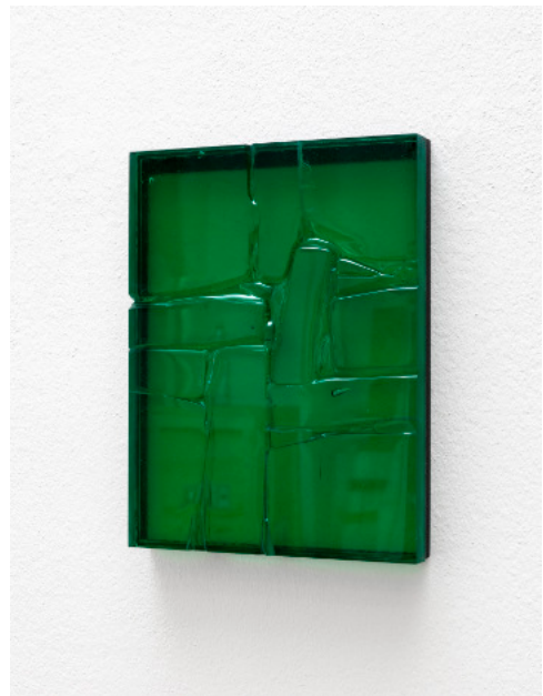
Kai Schiemenz Malerei II (grün), 2024 Glas 27,5 x 11 x 3,5 cm