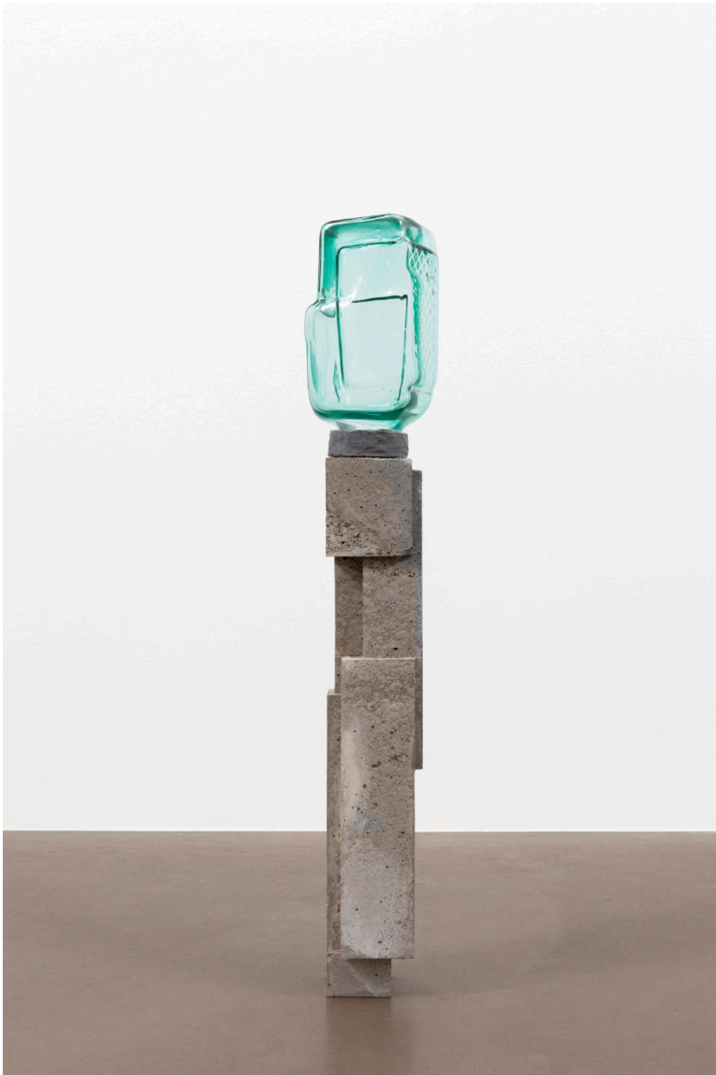
Kai Schiemenz Meine Zuversicht, 2024 Glas 34 x 19 x 17 cm