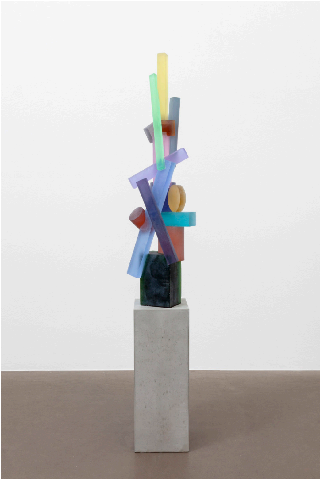
Kai Schiemenz Bell the cat, 2024 Glas 108 x 27 x 27 cm