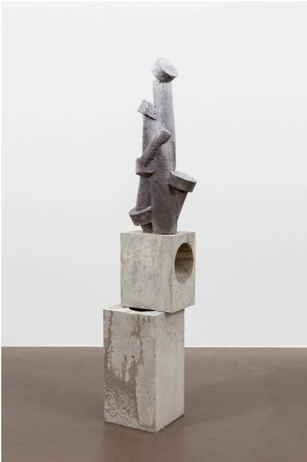
Kai Schiemenz Ane Titec (weiß), 2024 Keramik 58 x 24 x 14 cm