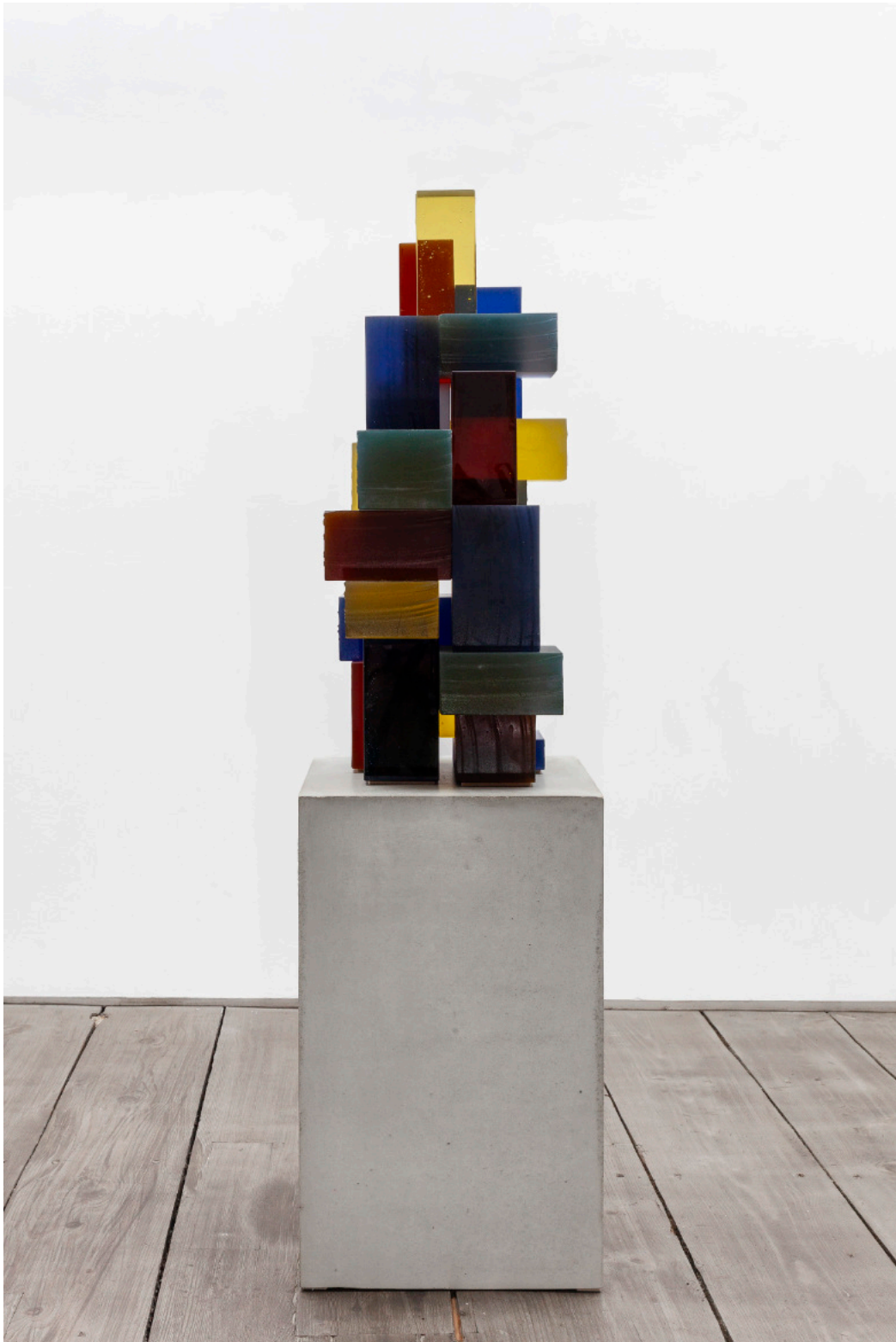
Kai Schiemenz Asmayda, 2023 Glas, Beton 76,5 x 29,5 x 30 cm