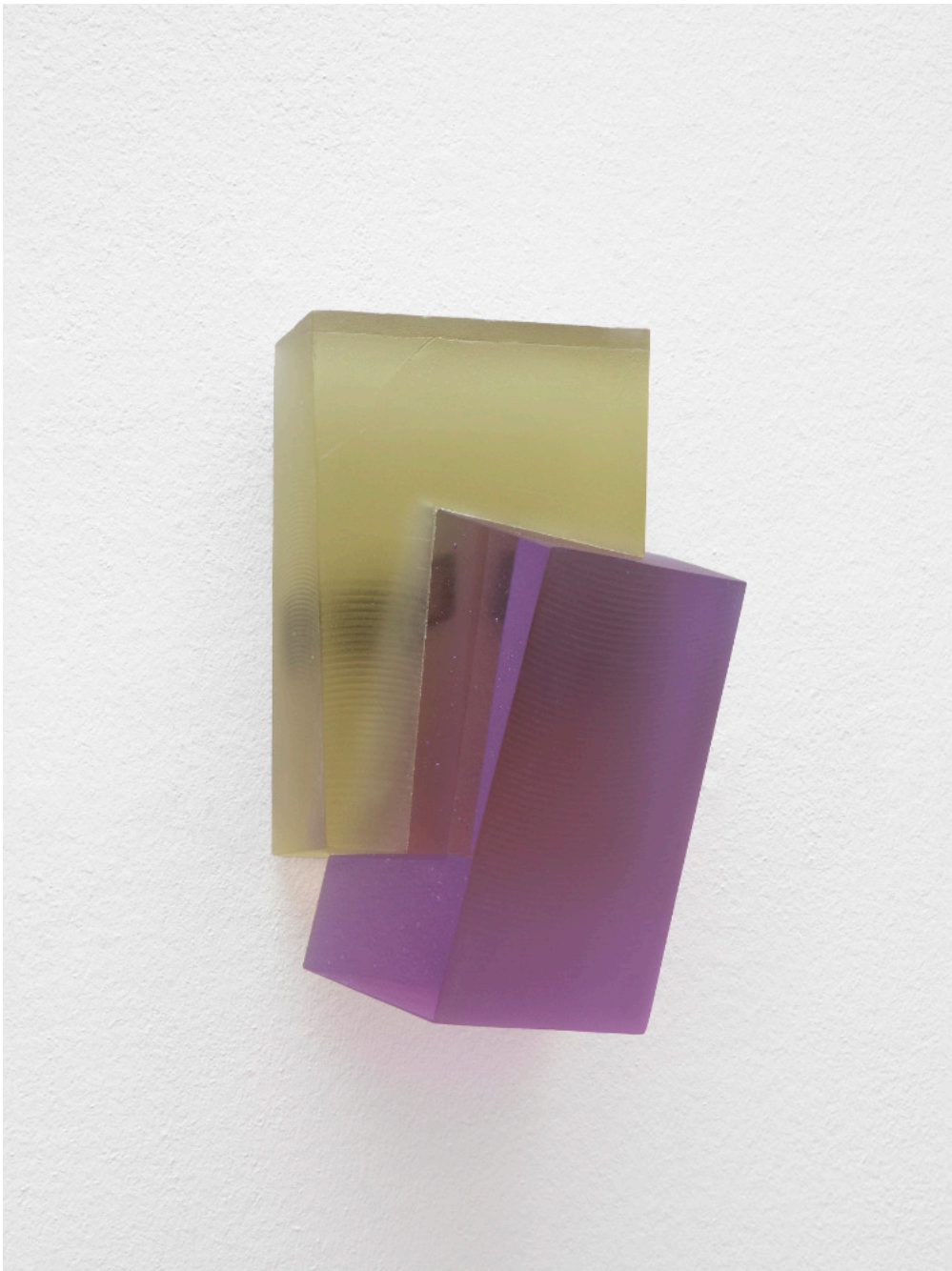
Kai Schiemenz Tilted Blocks I, 2024 Glas 28 x 17 x 17 cm