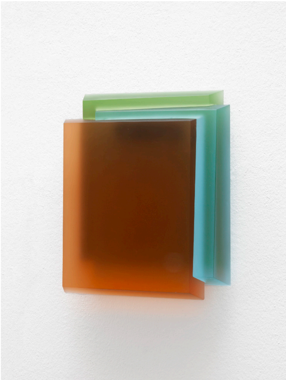
Kai Schiemenz Prismatic Plates VI, 2024 Glas 30 x 24 x 5 cm