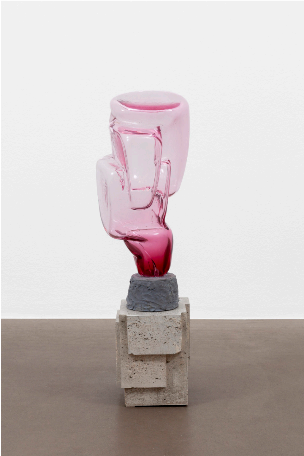
Kai Schiemenz Tilt-A-Whirl, 2024 Glas, Beton 36 x 20 x 24 cm