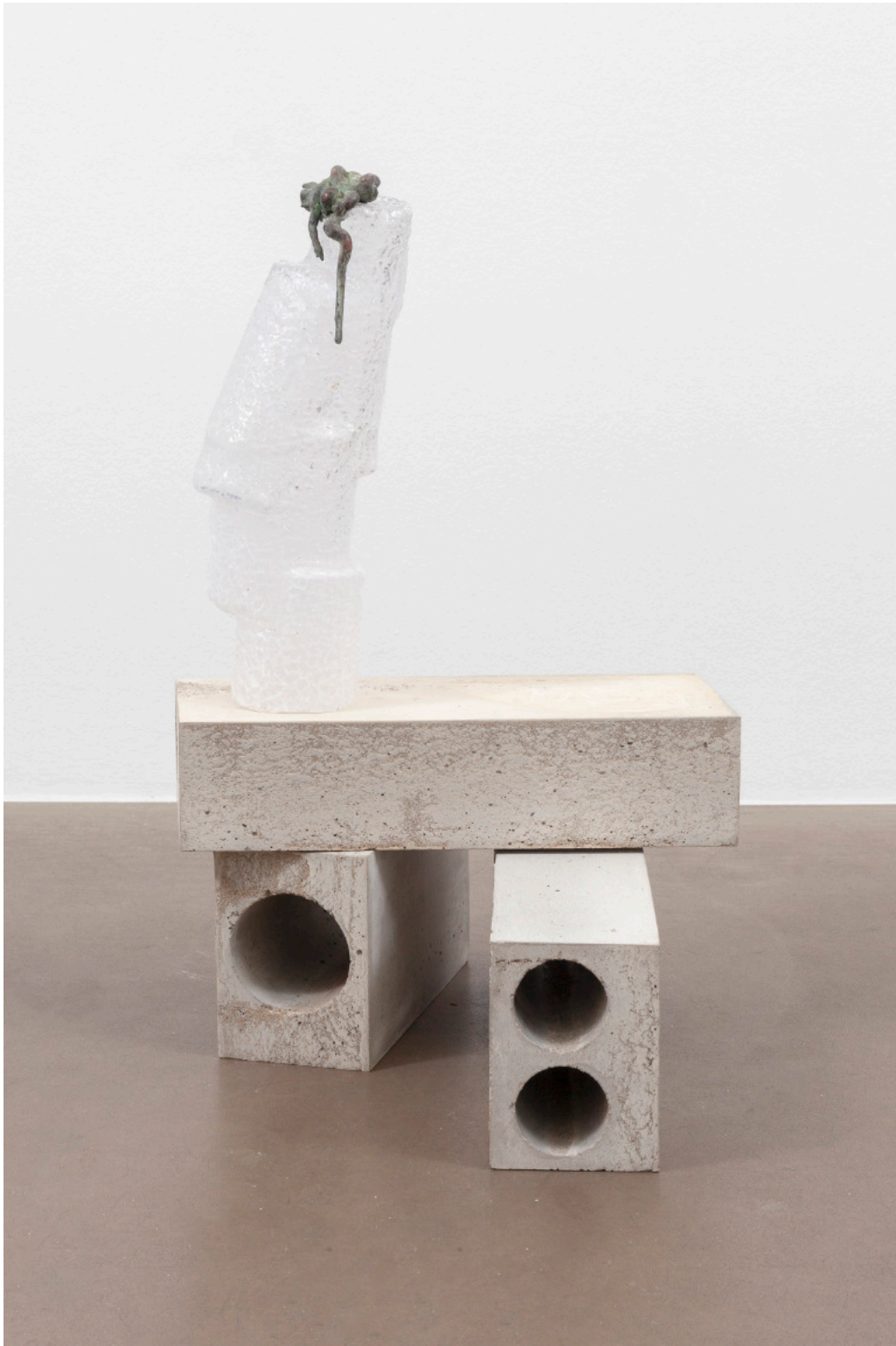
Kai Schiemenz Un Terrain Vague, 2024 Glas, Bronze patiniert, Beton 50 x 18 x 22 cm