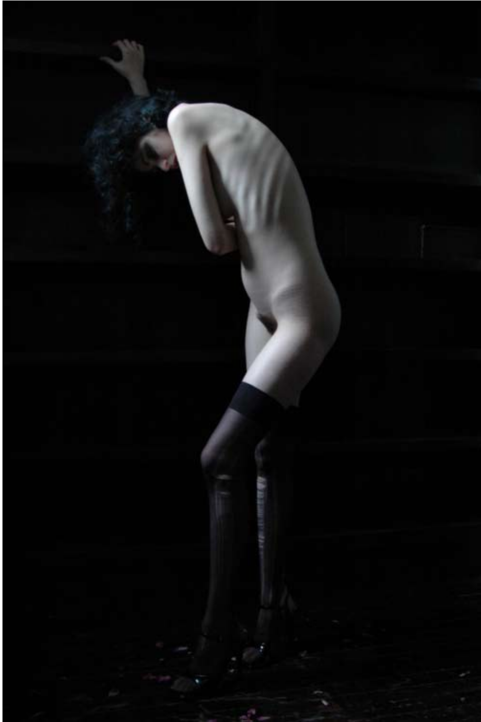
Martin Eder "Les Nus #0128" c-print, 240 x 160 cm 2006