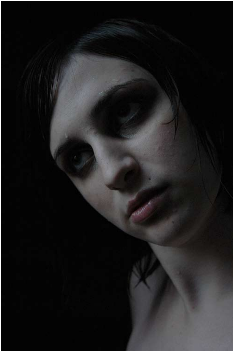
Martin Eder "Les Nus #0297" c-print, 240 x 160 cm 2006